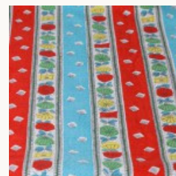
ヴィンテージフレンチコットンファブリック W90×47cm 1960年代頃