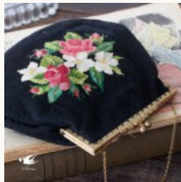
アンティークの薔薇のプチポワンバッグ 1930-40年代頃