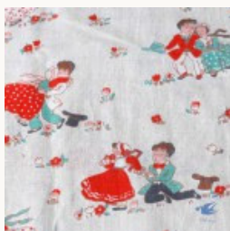
アンティークフレンチコットンファブリック 可愛い2人 76×50cm 1930年代頃

コンサートやおよばれのパーティーなど手回り品を入れるバッグは必需品です。口金のマーカサイトの外れもなく良い状態です。