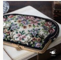
アンティークの薔薇のプチポワンバッグ 1930-40年代頃

ニードルポイントは薔薇の部分だけでなく黒い部分も全てニードルポイントされています。