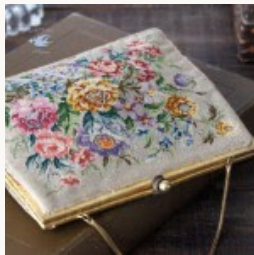
アンティークのベージュのプチポワンバッグ 1930年代頃