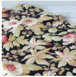
【再入荷】アンティークフレンチコットンフアブリック1900年代頃 82×40cm

シルバーにガラスストーンとマーカサイトのフラワーバスケットブローチ 1930年代