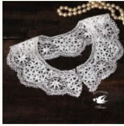
アンティークボビネースつけ襟 1910-20年代頃 gla-0791

シルバーにガラスストーンとマーカサイトのフラワーバスケットブローチ 1930年代