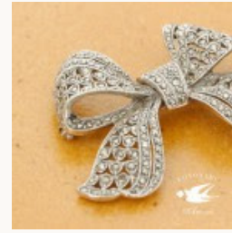
マーカサイトのリボンのブローチ 1940-50年代頃 ga-641