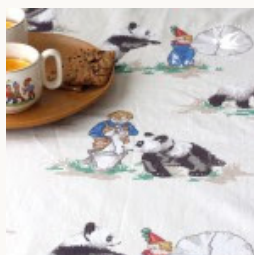
ヴィンテージ子供用パング柄カーテン1950-60年代W144×L148cm